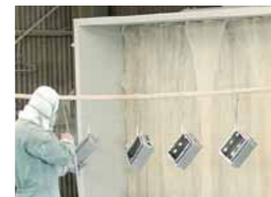
乾式固定ブースで塗装品をハンガーに掛けて準備している様子。

乾燥炉にて乾燥が完了した様子。ワーク寸法W4000×H2800の大型乾燥炉。大型の制御盤などから小型の塗装品まで、様々な塗装作業への対応が可能。