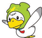
イメージキャラクター「カナモ」